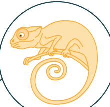
حرباء امراض النساء

يمكن أن يكون للاندوميتريوز (الانتباز البطاني الرحمي) اشكالا مختلفة جداً. هذا هو السبب في أنها تسمى أيضاً حرباء امراض النساء.